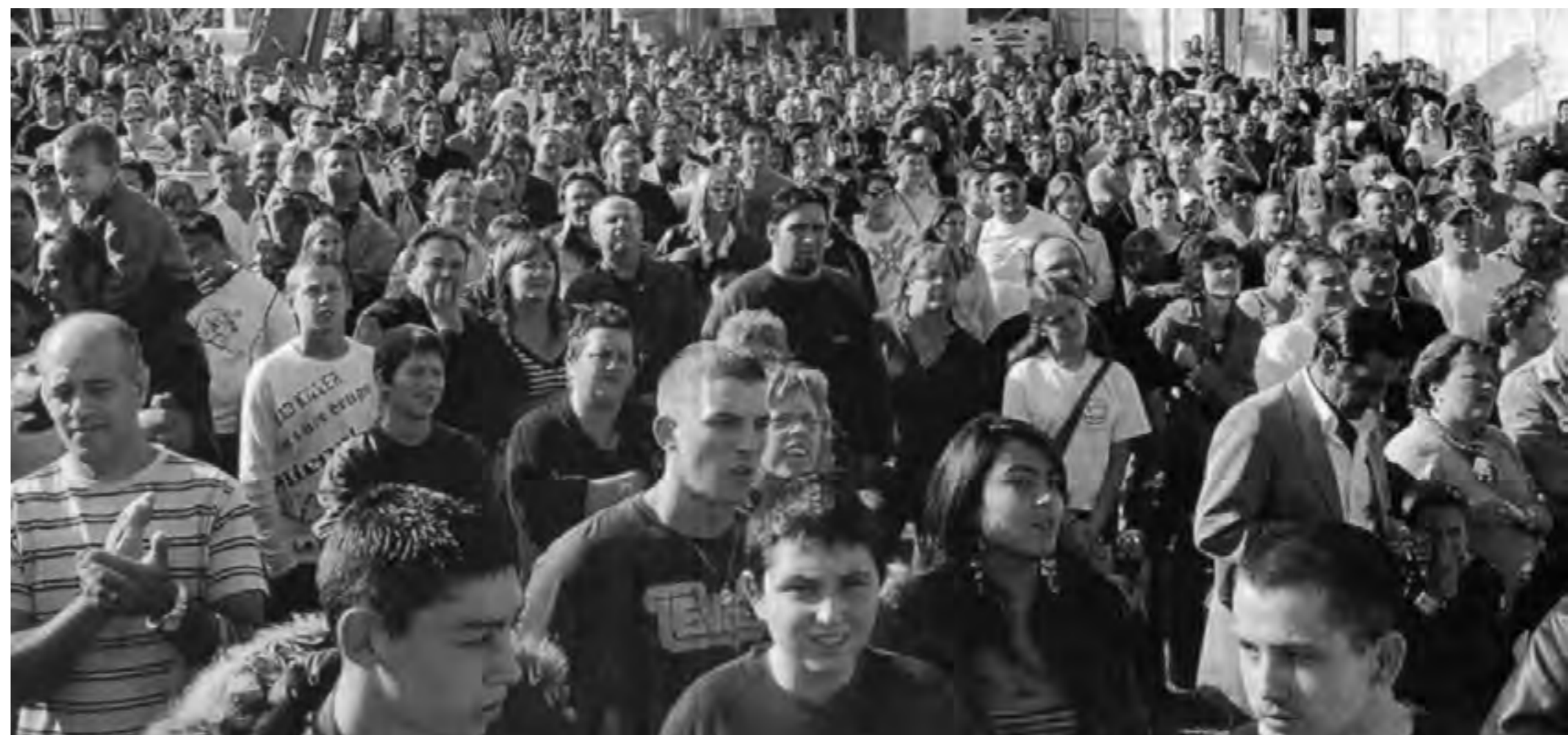
Recueillement devant le parc Bellevue qui abrite les débris de l'aéroplane.

lisis nec eu odio. Etiam sed ipsum leo. Etiam justo neque, lacinia quis laoreet nec, semper id ligula. Sed pellentesque felis sodales, tempus quam nec, congue justo. Ut pretium mi id auctor faucibus. Morbi sit amet tincidunt nibh. Nulla blandit molestie nulla vel fermentum. Fusce aliquet lectus risus, nec ultricies purus ultrices eu.