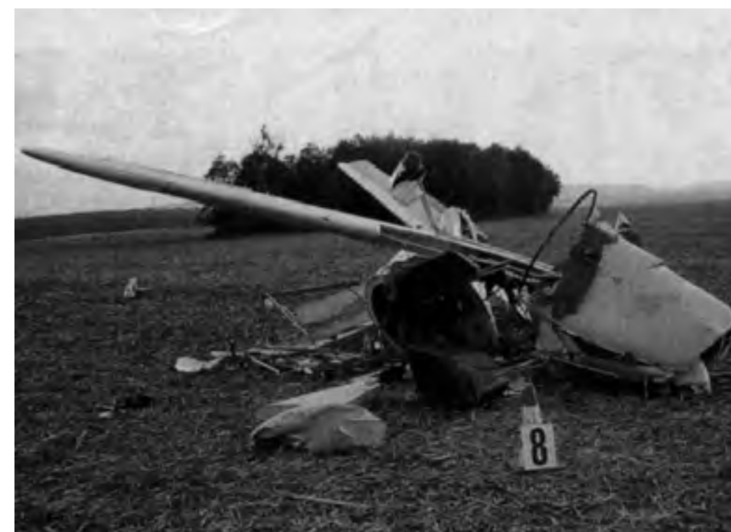
Après une évasion remarquée, l'infortuné s'est crashé à bord de son ULM.