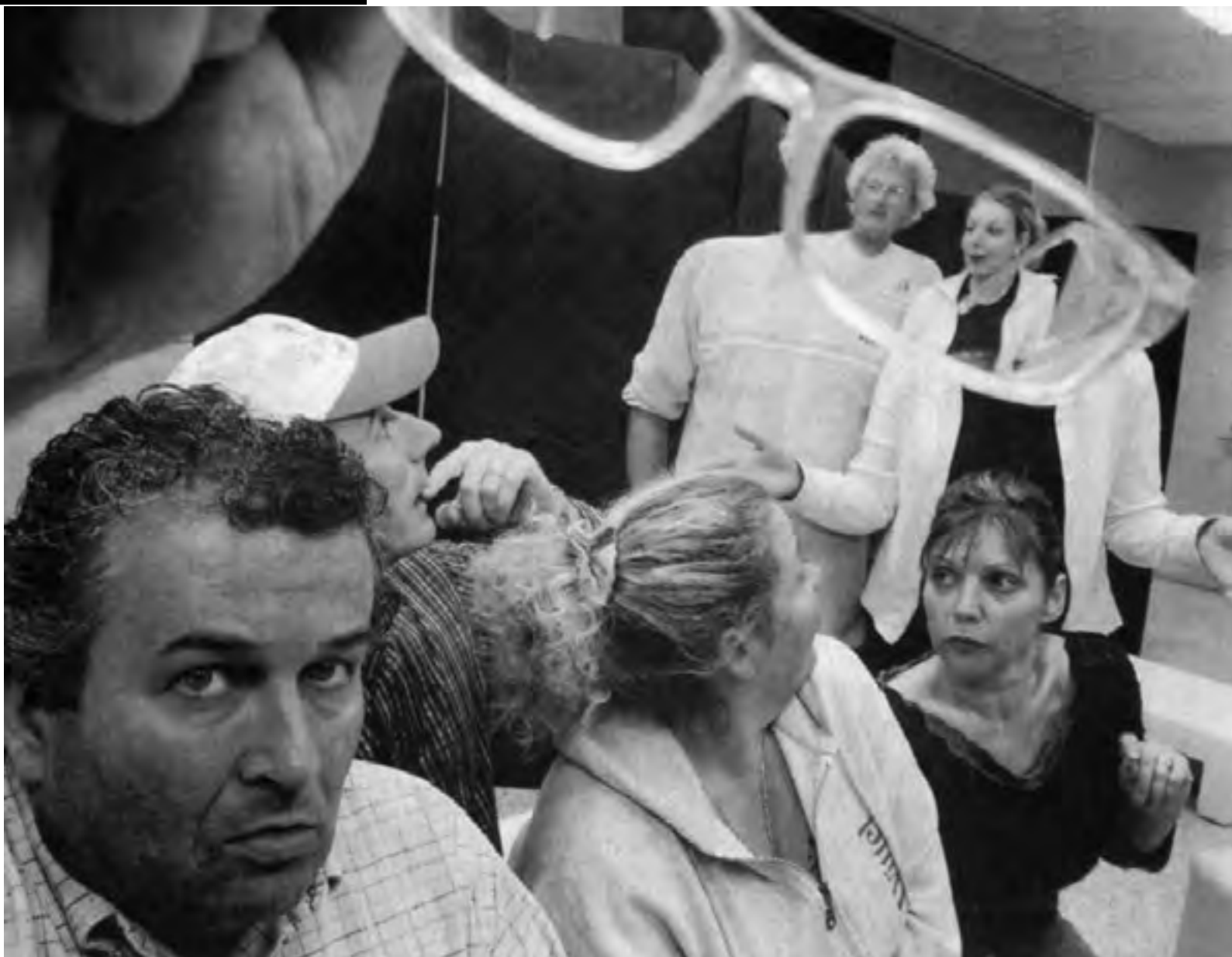
Déception des victimes qui attendaient l'audience depuis un an.

malesuada fames ac ante ipsum primis in faucibus. Maecenas aliquam turpis ac volutpat mollis. Morbi varius urna lorem, vel luctus elit egestas sed. Maecenas fermentum vehicula lacinia.