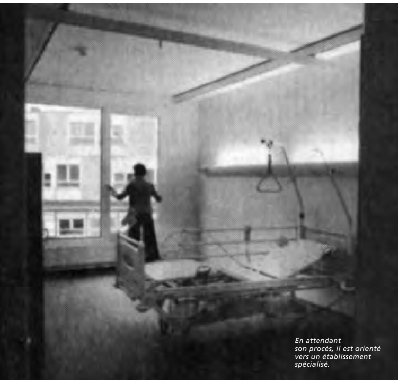
En attendant son procès, il est orienté vers un établissement spécialisé.