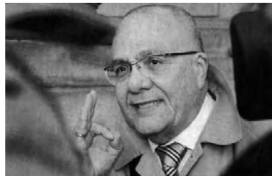
Le professeur Baratin, expert en neuro-psychiatrie, vient de publier un ouvrage.

Sed rutrum, ligula eget malesuada vestibulum, elit mi vulputate erat, id tincidunt turpis lorem nec augue. Nullam maximus