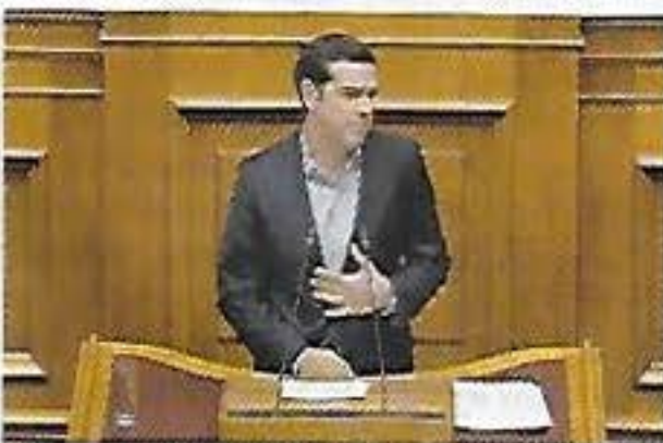
PAS DE PITIÉ POUR LES PAUVRES Alexis Tsipras, contraint d'accepter un nouveau tour de vis pour boucler son budget.

L es échéances se suivent et se ressemblent en Grèce. Une nouvelle fois, sous pression de ses créanciers et d'une Commission européenne qui sait manier l'arme du chantage, le Parlement d'Athènes a voté à une très courte majorité un nouveau tour de vis, protégé des manifestants qui défilaient dans la capitale. Au programme : une restriction du droit de grève et la vente aux enchères en ligne forcée de biens, notamment immobiliers, appartenant