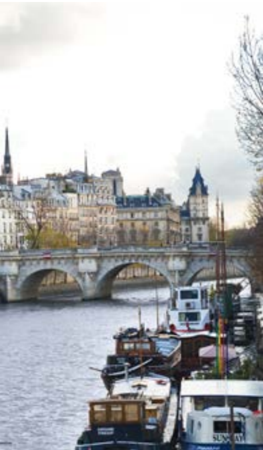
Le Pont-Neuf 2010

Napoléon considérait que les choses les plus importantes pour la ville étaient les eaux de l'Ourcq, les nouveaux marchés des Halles, les abattoirs et la Halle aux vins.