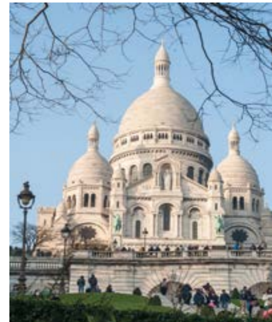
Le Sacré-Cœur 2013