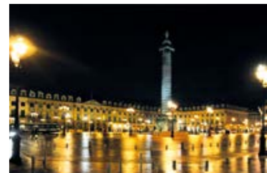
La place Vendôme 2009