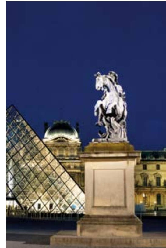
Le Louvre 2012

Les Tuileries sont élevées sous le règne de Charles IX. Henri III fait construire le Pont-Neuf qui relie la rive gauche à la rive droite.