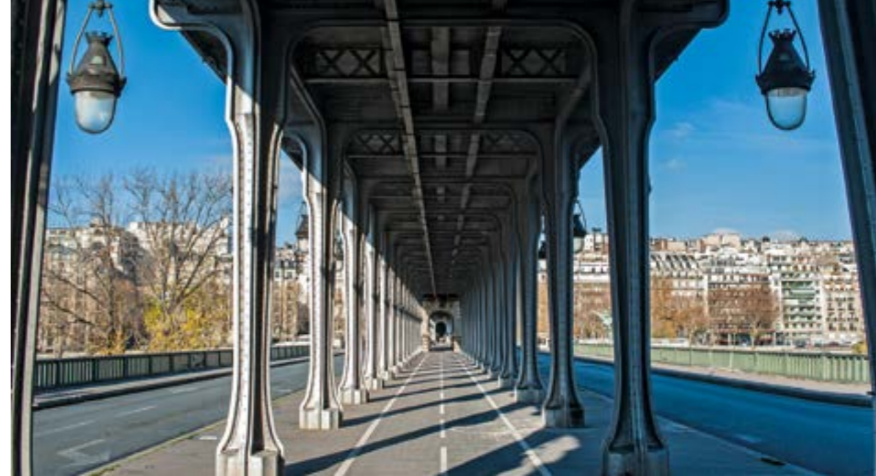
Le Pont Bir-Hakeim 2010