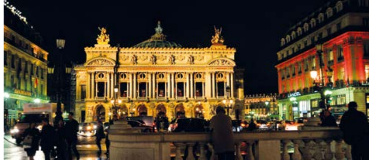
l'Opéra Garnier 2009