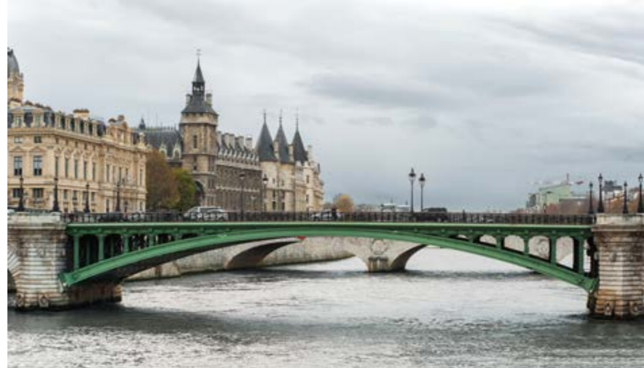
Le pont Notre-Dame 2010

Louis IX on voit s'élever de nouveaux collèges (La Sorbonne); la Sainte Chapelle. À cette époque, la vie à Paris se répartit ainsi: